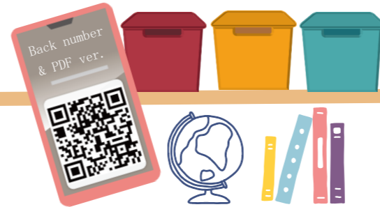
Table of Contents 目次