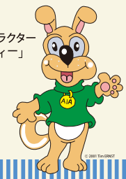
AIA キャラクター 「エディー」