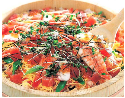
Gumawa ng recipe: Kikuchi Keiko (com.) Niji no machi kanri eiou shi )