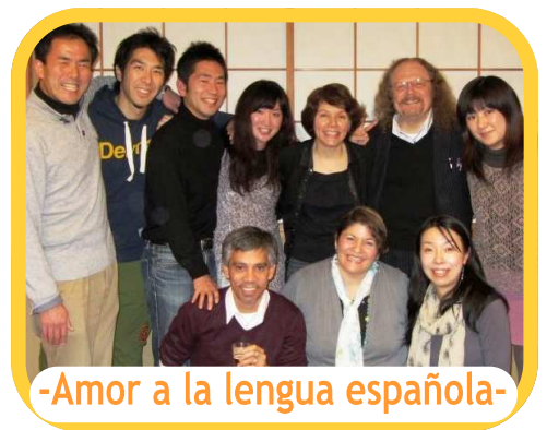
-Amor a la lengua española-

Sa mga taong gustong magsimulang mag-aral ng salitang espanol at sa mga taong gustong matuto ng pangalawang lingguwahe , halina' t sumali.