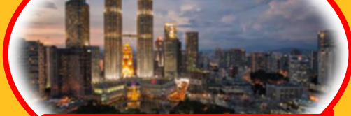
マレーシアの首都「クアラルンプール」