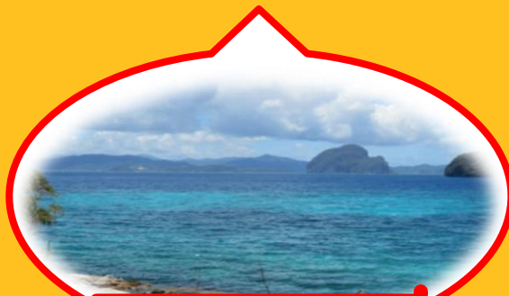
フィリピンのパラワン島のビーチ