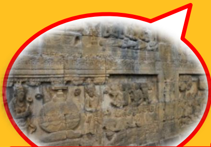
インドネシアの「ボロブドゥール」