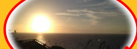
インドネシアのバリ島の夕日